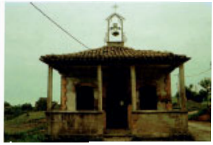
IbaAarrietako Santo Kristoren basiliza.

Baselizak portada arku zorrotzekoa du. Badu gainera, bestelako ezaugarri gotikorik, aldamen bateko fatxadan hirubulotako leihoa esaterako. Gaur egun bazter utzita dago.