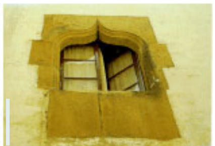
Iraeta etxeke leihoa.