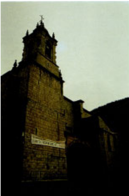
Jaiokundeko Andra Mariaren parroki-eliza.

Urberoei lotutako ostatu industriaz gain, izan dira berriki aribide ekonomiko garrantzitsuak, Akuako ibarrean ikatz-mearen ustiapena esate baterako, Izarraitzko harri-naba-