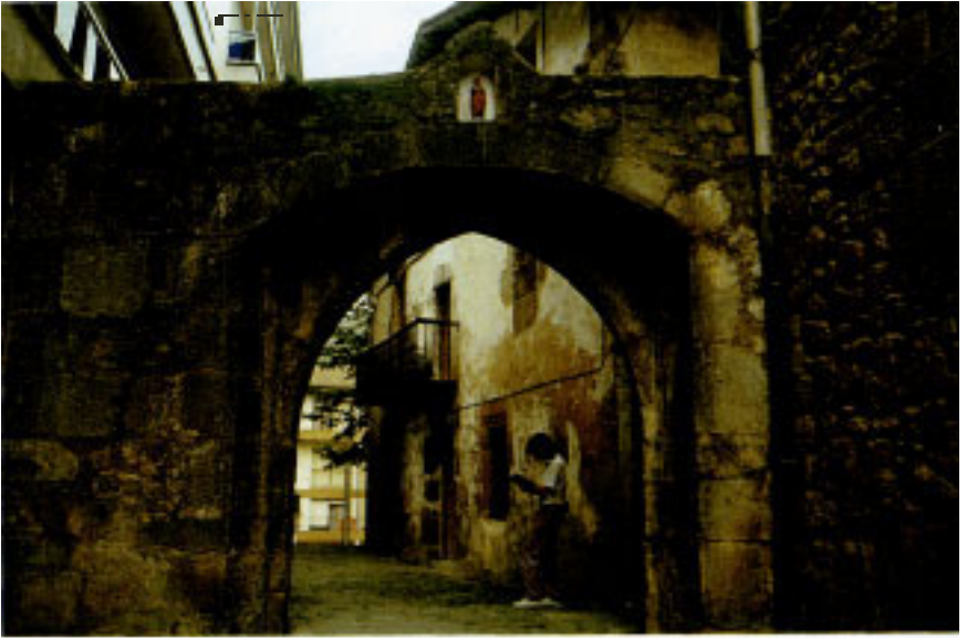
San Joseko ataria.

harresi batek zedarrizten zituela, Kale Nagusia heki-mendebalde bidea jarraiki eta hau biltzen dutela bi kale, muturretan bat egiten zutenak herriari almendra itxura emanaz. Sarrera-irterak harresian zabalduak lau ataritan zehar egiten ziren, lau haizetara norabidetuak. Herria Urolako Errege Bideak zeharkatzen zuen Beduako ibai-portu aldera, itsasoz merkatalgaiak ekarri ohi zituzten lekua. Merkatal bide garrantzitsu honez gain, hirigunea Aizarna Deba eta Zumaiarekin bat egiten zuten bestelako bideen elkar-gunea Zen.