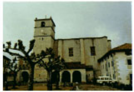
Aizarnako Jasokundeko Andra Mariaren parrokia-eliza.