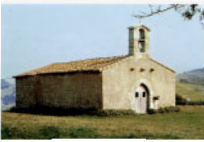
San Lorentzo basiliza.

nazabalerako bideari auzo-bidexka bidez etusi zaion.