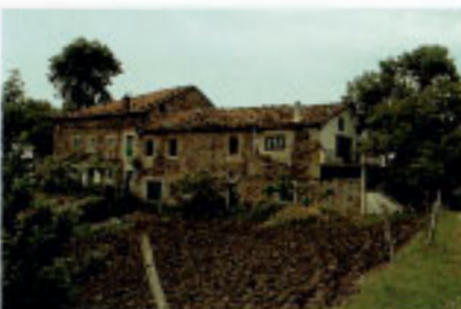
Etxeandia Portuenea baserria.

Bidea galdu bada ere, honi uztarturiko testigantzarik gorde da, San Llorente edo San Lorentzo basiliza esate baterako (10-24). Bertan, XIV. mende aldera Zumaia eta Zestoa arteko udal barrutiei buruzko akordioa itundu Zen.