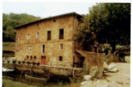
Beduako lonja eta errenteria.

Hirigunetik eta are ibarretik ere, urrutien dagoen auzoa. Egoera hauxe izan Zen bertako biztanleek 1383an Zestoako Santa