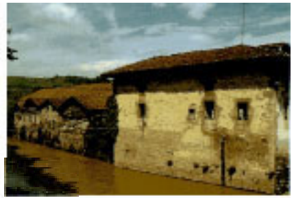
Iraeta ko "Granero" etxea.

Endoia auzopetik Sastarrin erreka igarotzen da eta inguruan Ekaingo Koba lekutzen da (10-38), Paleolitiko garaiko haitz-pintura ospetsuak direla eta oso ezaguna. Debako udal barrutian barne-harturik dago Ekain mendiaren parean zulatutako Erlaitzko koba (10-39). Historiaren, bi kultur atal ezberdinetan okupatua izan da: Goi Paleolitikoan