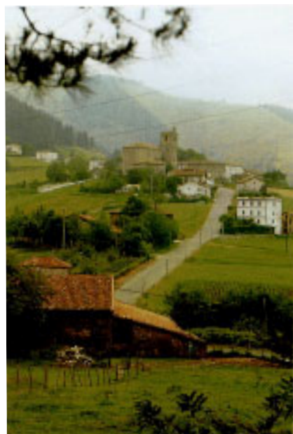
Arronaren ikuspegi orokorra.

XVIII. mendetik aurrera egindako errepide birrantolaketak bide nagusietatik at utzi du antzin bidexka hau, nahiz eta Aizar-