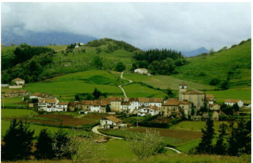
Aizarnaren gaineko ikuspegi orokorra.

Kilometro gutxiren buruan, Aizarna lekutzen den ibarreraino igotzen da eta bertatik Iraetako haranaren gaineko ikaragarritzko ikuspegia dago. Bidean gora egin ahala Lizasoeta Haundi (11-20) baserriaren ingurutik igarotzen da bidea gainbehera dagoen baserritzar ederra izan arren, oraindik ere handitasun itxura daukana; San Juan baseliza (11-21) eta Askatatzu baserri paretik ere (11-22) igarotzen da bidea. Baseliza apala eta neurritz txikia da. Egungo itxura XVIII. mendean egindako zaharberitze lanen ondorio da.