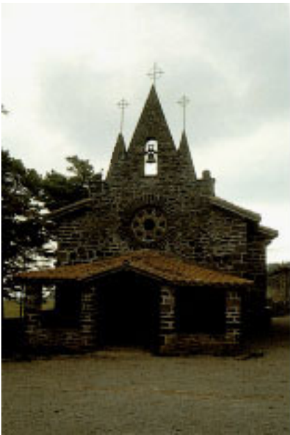
Endoia ko baseliza.

nazimendura hurbiltzen duten ezaugarri batzu dituela. Izarraizko harlanduz egina, igarotako mende guztiak igaro direla ere, ertaroko usain freskoa hartzen zaio. Oinplanoa angeluzuzena da eta altuerak lurraren goi-beheei egokitzen zaizkie. Leiho bikoitz oso bitxiak ditu eta fatxadetan sakabanaturik beste elementu ojibal batzu ikus daitezke. Ertzetako zaigelak eta teilatuko xurrutarriak nabarmentzen dira.