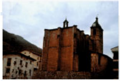
Santa Katalina parroki-eliza.