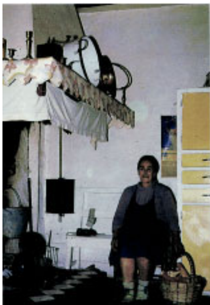
Bengoetxea baserriko beheko sua.

K ale Nagusiak, Gurutze-Bideak, Elbarrenak, Elizalde, Iturraldek eta Txirrita bertso-lariaren plazak osaten dute hirigunea. Lehen bi kaleak Araxes ibaiaren ezker aldean lekutzen dira, Nafarroarako Errege Galtzadaren igarogune inguruan, hiri-tajuketa txukunari eutsiaz. Gainerakoak beste aldean sakabanaturik lekutzen dira, baina ikusten da nolabaiteko bide-ardatza, Elba-