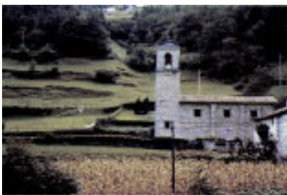
Sagrarioko Andra Mariaren basiliza.

Herriaren beste aldean Sagrarioko Amaren basiliza (31-41) inguruan lekutzen den