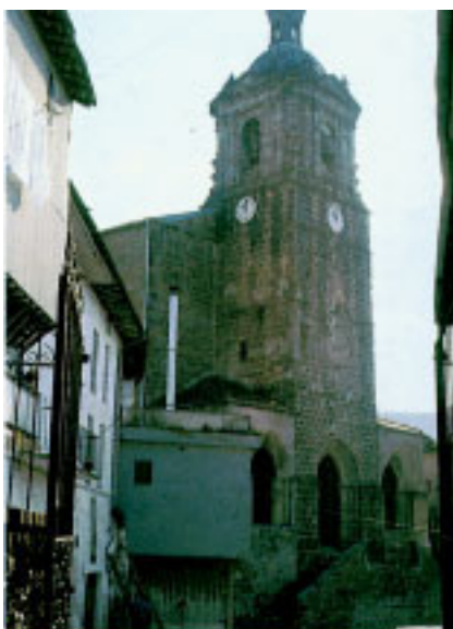
San Martin parroki-eliza.

Herri honetako beste etxe aipagarri batzu, hilerrira eta Artzailuz auzo aldera doan bide ondoan dagoen Etxeberri (*7) eta Apaizetxea (*4) ditugu. Honen "garajeak", itxura errenazentista duten leiho eta zutabeak dituela, basiliza zahar bat dirudi: Plazatik apaizetxerainokotartean, tailaturiko buru bat ikus daiteke etxe baten fatxadan sartua (*5),