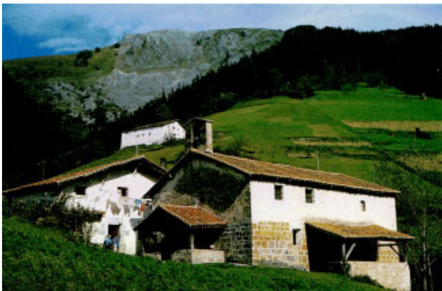
San Esteban basiliza.

kuntzarik gehienak biltzen ditu. Beste eremu batzuek ere, ibarretik gertu bait daude, Lete, Artzailuz edo Ibarbiak esate baterako, erakuntza kopuru polita besarkatzen dute.