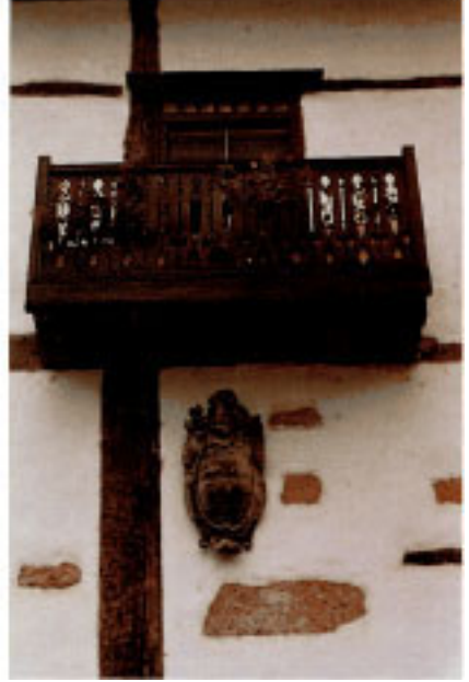
Etxeandia etxeko armarrria

Lurralde honetan biztanleen lekutzea erakusten duten lehenengo testigantzak Goi Paleolitikokoak dira. Garaiko hotzaldiek ehiztari-tribuak leizezuloetan biztatzera behartu