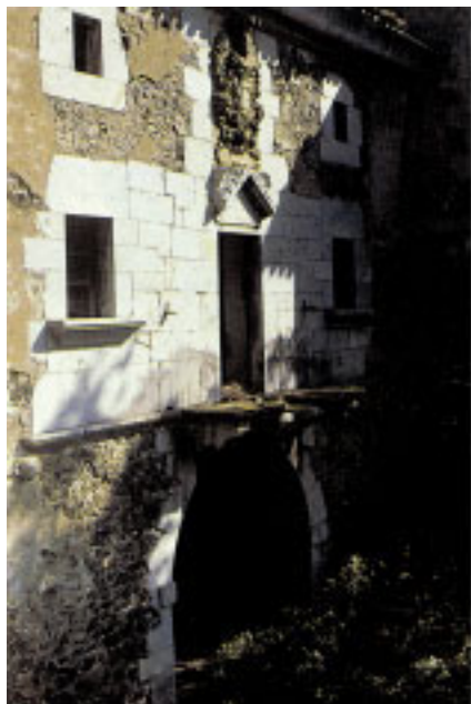
Sagartegieta baserriaren portada.