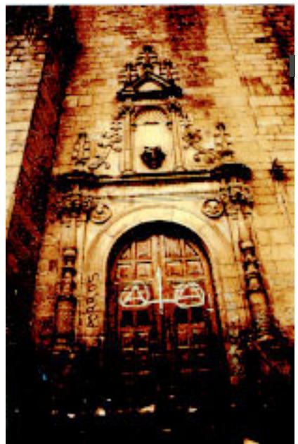
San Andres elizaren portada.

Bestetik Santa Krutz (15-7), Eibarko ibarraren ikuspegi ederra eskaintzen duen goigune batean lekutzen da. Neurri txikitakoa da eta itxura guztiz apalekoa. Hemen ere, portadak erdi puntuko arku da.