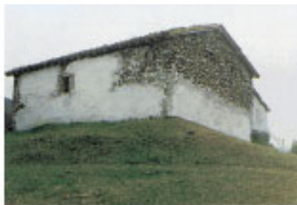
San Roman baseliza.

Udalerrian historikoki garrantzirik handien duen gunea dugu. Aspaldian bazter-utzitako komunikabide bati lotua azaltzen da, Elgeta eta Arrate bat egiten zituena. Dagoen kokagunetik Ego ibaiaren gaineko igarobidea kontrolpetzen Zen. Dorretxea gaur egun La Salleko ikastetxea den tokian zegoen. Etxea, oso berriztua (16-14), gorde da, eta baita arruntak ez diren botanika-ereduak dituen parkea ere. Dorretxea Untzetako gazteluari uzartu izan zaio; bertako biztanleak Alfonsito X. gaztelako erregeari aurka jarri zitzaizkion.