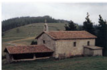
Eizmendiko San Miguel basiliza.

Herrigunetik halako gertutasun geografikoa izateak industri-aldiaren eraginpean