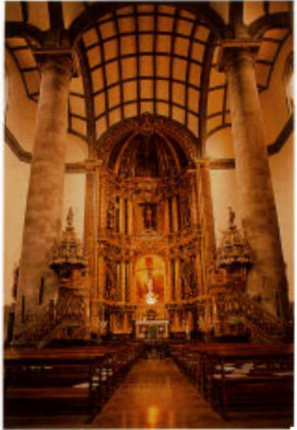
Soreasuko San Sebastian elizaren barrenaldea.

itzeleko gizona, oinetxe honetakoa da. Familiako dorretxean sortu zen, Enrique IV.aren agindua jarraiki berregin beharra izan ondoren eta idanik egoitzarako jauregi izaera hartuta.