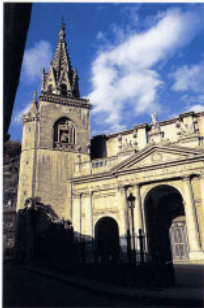
Soreasuko San Sebastian parrokia-Eliza.

Hautatu zen kokagunea balio estrategiko handienetakoa zen, Oria eta Debako mendarteetarako sarrerabide garrantzizkoak iragaiten ziren hainbat ibai eta errekaen elkargunea bait zen. Urolako ibarrak, bere erzetan biztanlegunea eraiki zuelarik, ibaiaren pare-parean zihoan igarobidea kontrol-