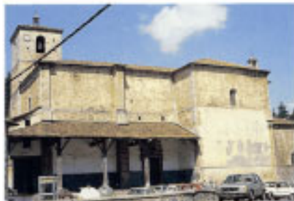
Urrestilako Jasokundeko Andra Mariaren eliza.

utzi du, jatorriz landa-eremu honetako hiritar egituraketan berriki aldaketak burutu direlarik.