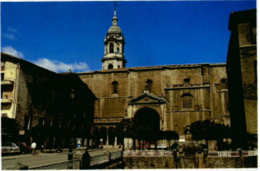
Santa Maria la Real parroki-eliza.

ekiteko saldu zen. Gaur egun Altzibar Jauregi izenez ezagutzen da. Kale honetan biltzen dira gainera, hiriguneko hainbat eraikuntza garrantzitsu. Olano etxea 70. zbk.an XVI. mendez geroztik jaso da agrietan. Abarda etxea, 74. zbk.an, jauretxea da. Armarría du. 89-91 zbk.etako Txurruka-etxea eta Rekalde 95.ean, antzineko Bizkargi izena egungoaren truke 1528an aldatu zuena, kale honetan aurki ditzakegun beste eraikuntza interesgarri batzuk dira.