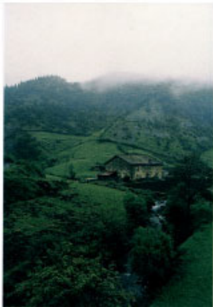
Erraiondo Zahar baserria (Aia).

kuondo auzoari egiten dio bide, errepeidea san Gregorioko gunera iritsi aurretik.