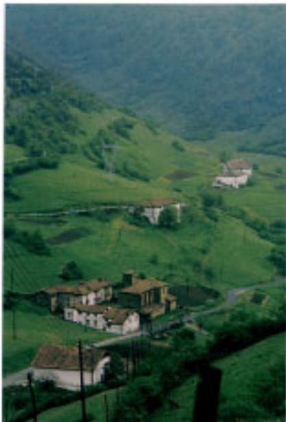
Santa Isabel eliza (Aia).

Dozena erdiren bat baserrik osatzen dute esparru hau, batik batik Lauti erreka inguruko ibarraren behe aldea hartzen dute.