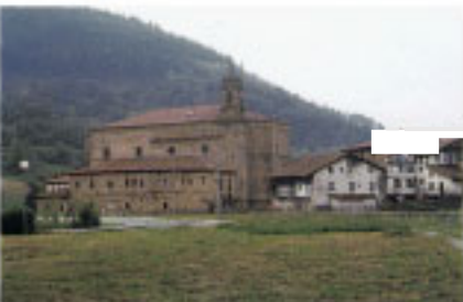
Toursko San Martin eliza.

Jentilbaratza baserriak (35-67) defendatzen du bertarako igarobidea; osperik handieneko aldia Erdi Aroan bizi izan zuen gotorlekua dugu hau, nahiz eta izango zuen nolabaiteko garrantziarik ere erromatarren