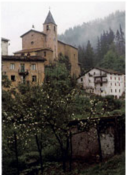
Gregorio Magno eliza.

Motasoroko Gurutzebidetik aurrera Arinberriaga auzoa zabaltzen da eta honek Mur-