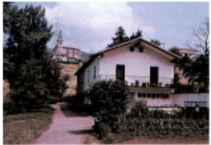
Gurutze Santuaren basiliza