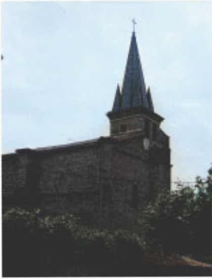
Jasokundeko Andra Mariaren parroki-eliza.