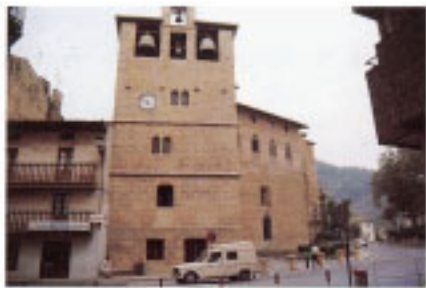
Iglesia Parroquial de Santa María la Real.

descripción detallada. El casco urbano estaba formado por 147 casas con su huerta en la mayor parte de los casos. Además, otras doce casas estarían abandonadas por miedo a incendios. Los caseríos serían setenta y tres. Poseía, asimismo, una ferrería abandonada por falta de montes y había cinco molinos labrantes.