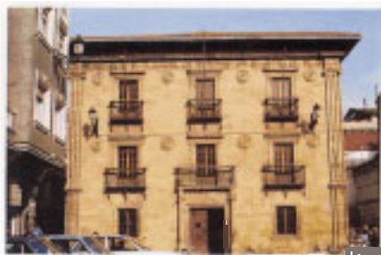
Palacio Portu (Casa Consistorial).

■ La familia Portu llegó a Zarautz procedente de Aia, en el siglo XVI. Fundaron la casa solar en la C/ Zigorria. La fachada muestra varios huecos ordenados en torno a la puerta de entrada. Dos columnas de orden corintio flanquean el acceso principal. Sostienen un frontón en cuyo interior se instala el anagrama J.H.S. En 1936 se destruyó la Casa Consistorial, por lo que el Ayuntamiento se trasladó a este edificio (*5).