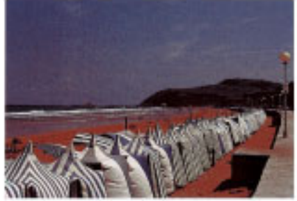
Playa de Zarautz.

Los pleitos de la villa con sus vecinos también han sido numerosos, destacando los que mantuvo con Getaria a causa de los