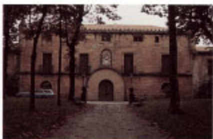
Fachada del Palacio de Narros.

El plano urbano de este sector ha heredado la trama de la población medieval. El recinto se supone amurallado, en origen, y organizándose en dos calles paralelas, Orape y Mayor, y dos cantones transversales, actuales Ipar Kalea y Azara kalea.