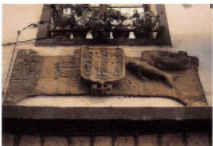
Detalle del dintel de la casa nº 2. ☐ Azara.

En la Musika Plaza se produce una asociación de edificios que puede considerarse representativa en relación al desarrollo de la villa. La casa Makatza o Makazaga (*12) es el testimonio más antiguo, probablemente del siglo XVI, mientras que la mayoría de los edificios de este espacio han sido construidos en fechas recientes. Varios de ellos reflejan el estilo neovasco de principios de este siglo. La marquesina del Bar Otamendi (*11), un ejemplo de primer orden de arquitectura modernista, contribuye a realzar la imagen contemporánea de esta vieja plaza.