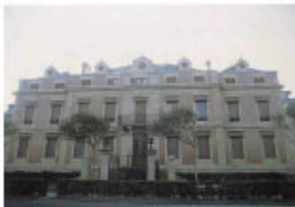
Casa Sanz Enea.

La entidad de Urteta se dispone a espaldas de la villa, en torno al valle de Olaa Erreka. Desde muy antiguo ha sido la zona ocupada por las instalaciones industriales de la población. Los molinos de Errota Zahar (11-56) y Errota Berri (11-57), todavía se conservan rodeados de talleres modernos, mientras que la ferrería que da nombre al río desapareció en el siglo XVIII.