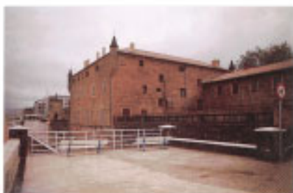
Trasera del Palacio de Narros.

El Palacio de Narros, se dispone en primera línea de playa. El edificio es del siglo XVI. Prototipo de palacete renacentista, está considerado como una de las construcciones nobles más sobresalientes del país.