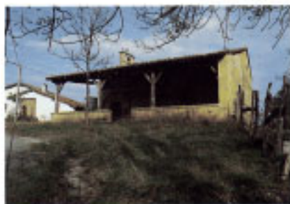
Ermita de San Sebastián de Urteta.

Al pie del monte, en el acantilado, se conserva una construcción monumental conocida con el nombre de Mollarri que corresponde al puerto de embarque de mineral procedente de las minas de Asteasu y Aia, habilitado a principios de este siglo (5-20).