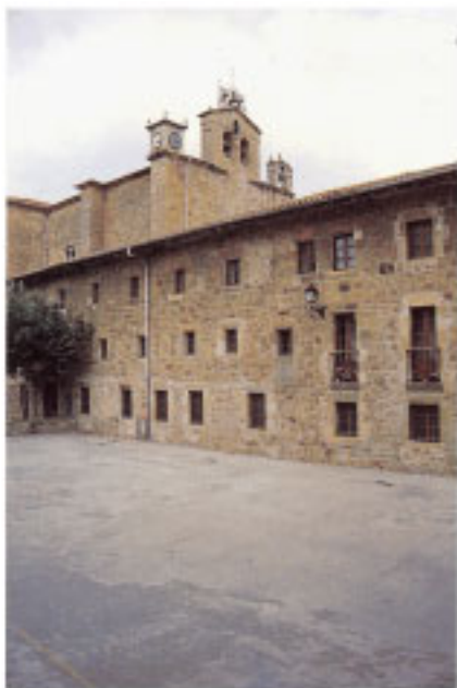
Convento de San Francisco.