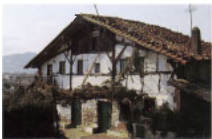
Caserío Agerre Bekoa.

El conjunto de edificios ligado al desarrollo moderno, constituye una parte importante del patrimonio de esta villa. A los suntuosos palacetes de la playa, Sanz Enea (*10) o Zeleta Berri (*9), hay que sumar otros edificios no residenciales como el Cine Modelo, el convento de las Carmelitas (*8) o la rotonda del parque de Vista Alegre (5-9). Este último se incluye entre las primeras construcciones de Gipuzkoa donde se empleó el hormigón armado.