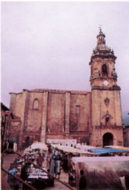
Iglesia Parroquial de San Salvador.

El primero forma una entidad organizada desde el siglo XIV, por lo menos. El origen de Zubieta hay que relacionarlo con una comunidad de campesinos que compartieron los gastos de la compra de los terrenos. El grupo permaneció unido con la idea de gestionarlos de forma global y aumentar el patrimonio. En 1494 compraron a Pedro de Aizpurua y a su hijo, dos molinos en el Oria. En 1503 la casa de Oyanguren, en 1529 el caserío Goi-goetxe, y entre 1600 y 1660 construyeron la iglesia. También hicieron un puente de piedra sobre el Oria, y se sabe que disponían de astilleros en terrenos de Urdaiaga.