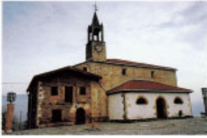
Ermita de San Esteban de Urdaiaga.