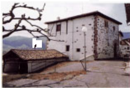
Casa Konseju Zahar.

Se han mantenido también la ermita de Nuestra Señora del Socorro (*5) y el Humilladero (*6). La primera fue el hospital de la villa, donde se atendía a los enfermos y desheredados.