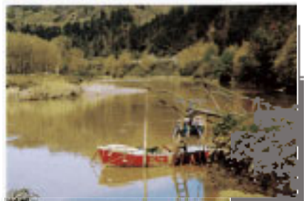
Embarcadero en Aginaga

La ruta que se inicia en Aginaga, frente a la gasolinera, cruza el río al par del apeadero del ferrocarril San Sebastián-Bilbao. Desde este punto se accede a los caseríos Iparragirre (12-33), Goiko Errota (12-39), y Urdaiaga (12-40), una de las casas solares principales de la población, y que fue propietaria entre otras cosas de los astilleros del barrio. En el edificio construido en buena sillería, se han conservado un buen número de testimonios de su pasado, como ventanas trilobuladas, modillones, arcos, etc. que pueden remontarse al Medioevo.