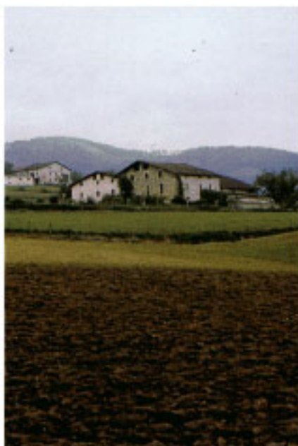
Caserío Bengoetxe Haundi.

Etxeberritxu (35-18), Bengoetxe Txiki (35-17), Bengoetxe Haundi (35-16), Etxesagaberri (35-15) o Miraballes (35-14) son otros caseríos de interés colocados en las inmediaciones de la carretera a Iurre, mientras que en la carretera a Lazkao se sitúan Sagastillume (35-36) y la casa solar de Otsoategi (35-37), antes citada.