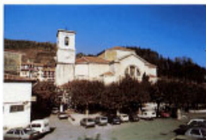
Iglesia Parroquial de Nuestra Señora de la Asunción.