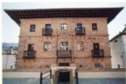
Palacio de Zabel.

Edificio de cuatro alturas que sobresale en la manzana. Podría ser la torre de Barrenkale de la que hablan autores del siglo XIX. Presenta abundantes vanos geminados y accesos en forma de arco de medio punto.