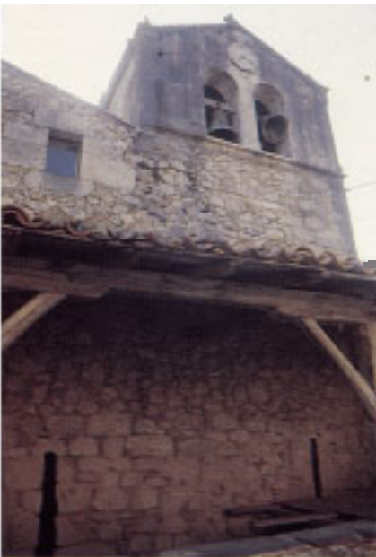
Iglesia de San Andrés de Astigarribia.

Los caseríos de las inmediaciones, algunos de ellos ya citados: como Jauregi, Torre, además de Etxezabal (10-2), han conservado elementos constructivos de época medieval. Destacan los arcos apuntados y