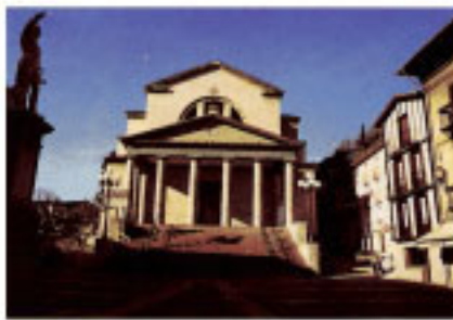
Plaza Txurruka con la Iglesia Parroquial de Nuestra Señora de la Asunción.

El templo, con planta de cruz griega y cuatro bellas columnas dóricas sobre las que se asientan los arcos, presenta pórtico autónomo y torre en la cabecera. Se estructura en varios volúmenes, bien jerarquizados, cuya organización permite la configuración