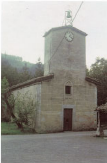
Iglesia de San Isidro de Olatz.

Muy cerca de la playa se coloca la casa Saturrarán Zahar (3-9), una antigua casa solar. El edificio muy reformado conserva un escudo con las armas de los Areilza y los Churruca. Parece que la construcción original data del siglo XVIII.