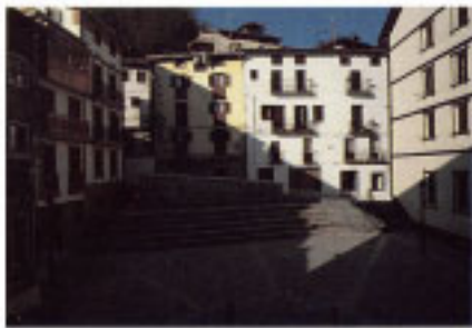
Plaza en Erdiko Kale.

la Armada del Rey, en 1731. Los muros son de sillería hasta la segunda planta, colocándose los escudos en la planta primera, a ambos lados del balcón principal.