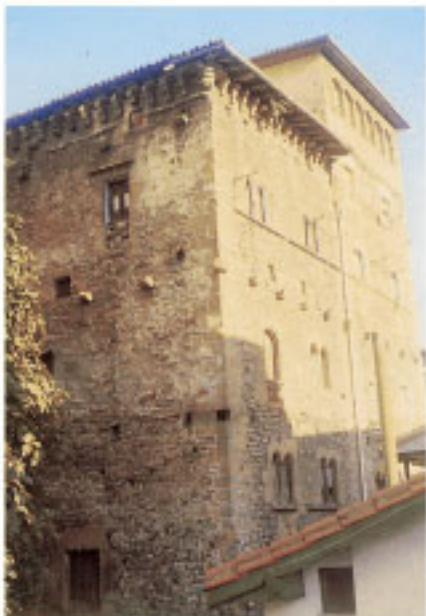
Casa Torre de Berriatua.

en el puerto. Allí se concentran varios de los edificios singulares. La protección del puerto les llevó incluso a construir una fortificación desaparecida en la actualidad.