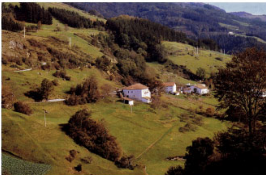
Conjunto de caseríos de Leaburu (Arbola Txiki, Agerre, etc.).