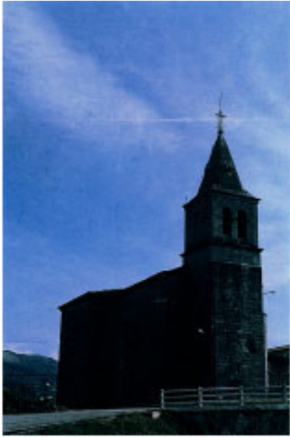
Iglesia Parroquial de San Pedro de Leaburu.