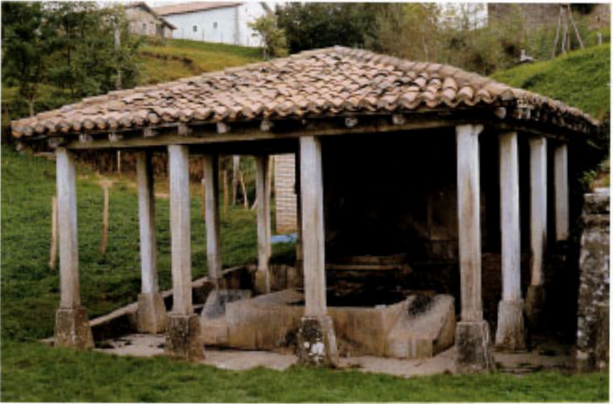
Lavadero de Gaztelu.