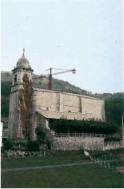
Iglesia de Nuestra Señora de la Asunción de Gaztelu.

nas de lo que debió ser una casa-torre. El acceso es difícil debido a que el caserío se abandonó a principios de siglo, y la vegetación se ha extendido por la zona.