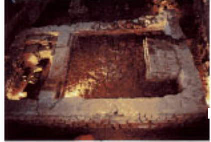
Yacimiento de Santa Elena.

La "ciudad" se situaba, entonces, al borde del mar, en las orillas del gran estua-