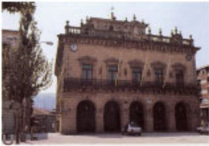
■ Casa Consistorial. Fachada principal.

alcaldes procedentes del solar de referencia. En la memoria reciente todavía se conserva el recuerdo del pintor José Salís, que inauguró una saga de artistas e intelectuales inintercumpida hasta el momento.