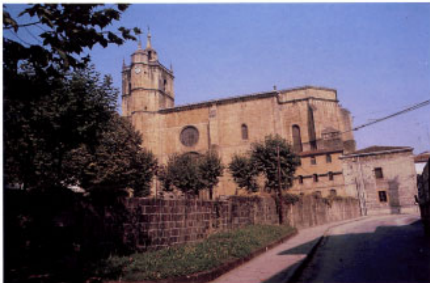
Iglesia Parroquial de Nuestra Señora del Juncal.

Buen Seguro, del Buen Consejo y de Santa María de Irún.