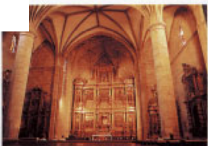
Interior de la Iglesia Parroquial de Nuestra Señora del Juncal.

La Iglesia de Nuestra Señora de El Juncal debe su nombre a la aparición, en 1400, de una talla de la Virgen en los juncales que bordeaban al estuario. Ha recibido también la denominación de Nuestra Señora del