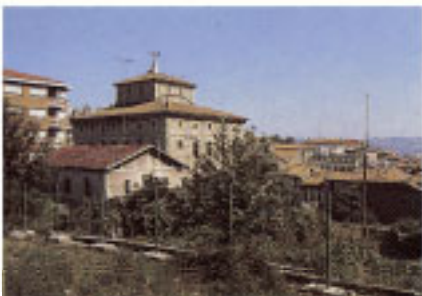
Casa Consistorial. Vista trasera.

El incendio que destruyó parte del casco de Irún, en 1936, afectó también a una de las casas más representativas de la población: el Palacio de Arbelaitz. Por esa razón hubo