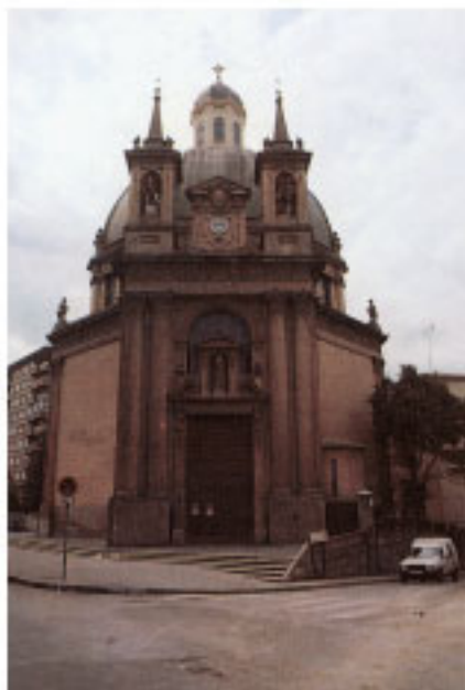
Iglesia de San Gabrieri y Santa Genma.