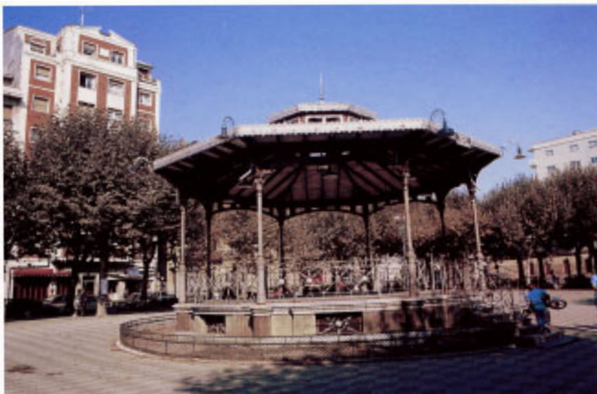
Kiosko de Música de la Plaza del Ensanche.

En la misma se encuentran ejemplos de arquitectura contemporánea de interés: el Casino en el número 23, el edificio racionalista construido en 1936 y reconstruido tras