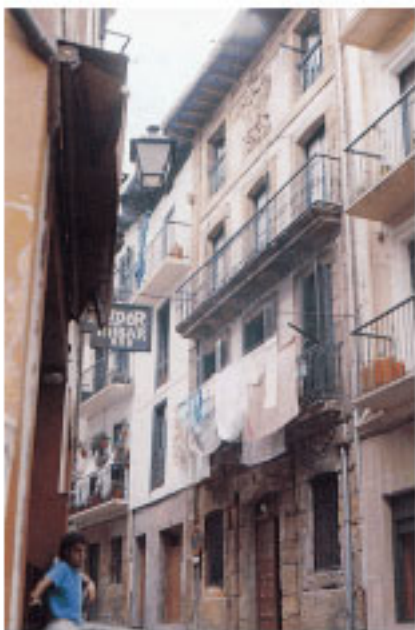
Casas en la CI Larretxi.

paso de las sucesivas oleadas de invasiones, saqueos, etc.