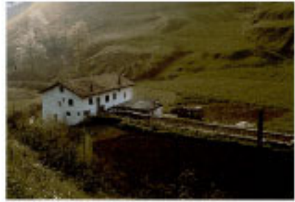
Molino de Erdiko brota.

Un suceso muy comentado en las crónicas locales, lo protagonizó el conocido y mítico "Cura de Santa Cruz" que logró huir de la localidad cuando estaba a punto de ser detenido.