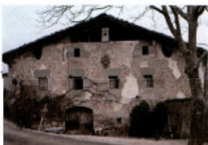
Casa Anotzaga Haundi.

■ El Ayuntamiento (*2) es la edificación más cercana. Destaca la cubierta rematada con una veleta, el Kontxupe de 4 arcos y un bonito reloj mecánico. El escudo del lugar también está presente.