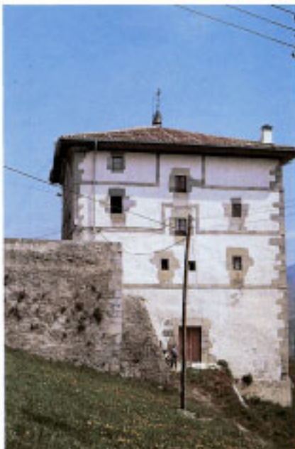
Casa Consistorial. Vista lateral.

En la cueva de Aizkoate (24-80) se recogió un hacha pulimentada, que prueba la ocupación de este territorio ya en la Prehistoria.