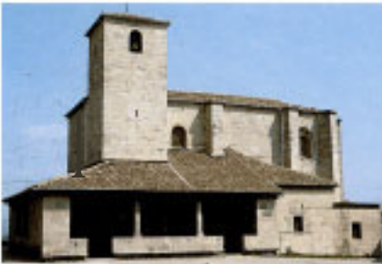
Iglesia Parroquial de Nuestra Señora de la Asunción.

No fue hasta el pasado siglo, 1802, cuando Hernialde obtiene el título de villa con sus correspondientes prerrogativas. La nueva villa se incorporó a la unión política de Ainsberreluz, al objeto de hacer factible el hecho de enviar y mantener un representante en las Juntas de la Provincia.