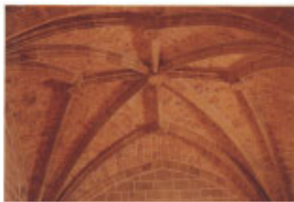
Bóveda de la Iglesia de San Martín de Azkizu.