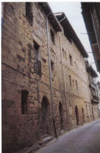
Casas medievales en la C/ San Roque.

En principio, las viviendas fueron de madera. Durante la época medieval se construyen algunas casas en piedra, palacios