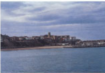
Vista general del casco de la población.

1407. Los navíos que aportasen trigo y otros cereales a la concha y muelle de la villa debían descargar la mitad de la carga para provisión de sus vecinos.