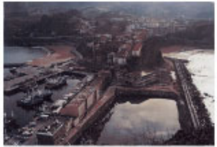
La villa medieval y el puerto.

Desde que Gipuzkoa entra a formar parte de la corona castellana en 1200, la