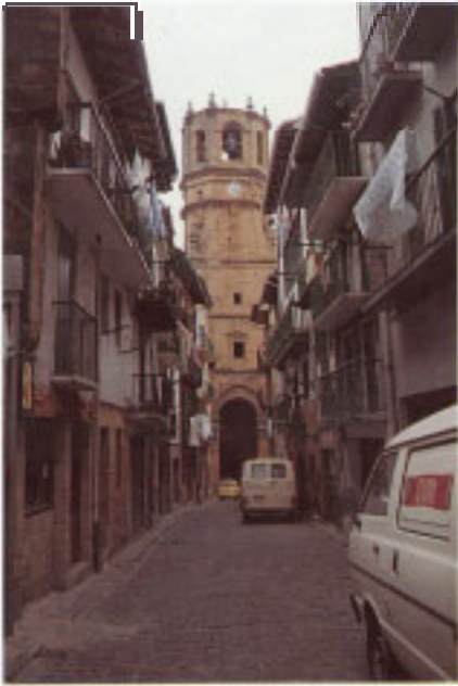
Iglesia Parroquial de San Salvador.

Sólo faltaron a aquella reunión los pueblos del Valle de Léniz y Oñate, sujetos al dominio feudal de los Guevara.