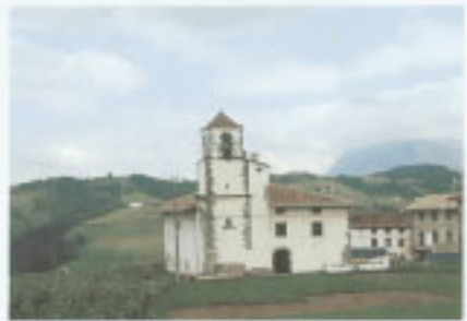
Iglesia Parroquial de Nuestra Señora de la Asunción.

En 1967 entró a formar parte del municipio de Iruerrieta junto con Orendain e Ikaztegieta. Esta entidad ha dejado de tener vigor recientemente.