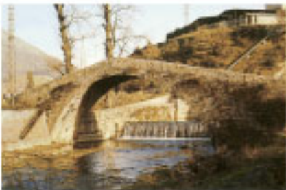
Puente de Umabe.

Entre las construcciones rurales sobresale el caserío Xerra, una antigua ferrería hidráulica convertida en serrería (23-14)