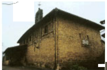
Ermita de Oñaz

Aranguren (23-33), Mendizabal, y Alzaga (23-34) son también caseríos cuya existencia se documenta en la Edad Media.