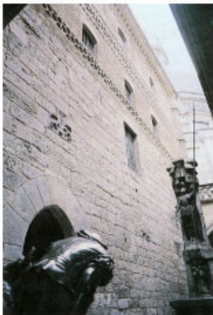
Casa-torre de Loiola.

El convento de franciscanas se dispone frente al palacio de Enparan. Se fundó, como la mayoría de los monasterios de Gipuzkoa, en el siglo XVI.