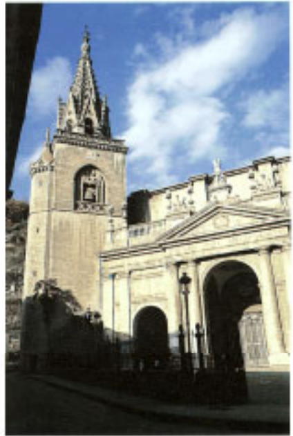
Iglesia Parroquial de San Sebastián de Soreasu

El emplazamiento elegido contaba con buenos valores estratégicos, al tratarse del punto de confluencia de varios ríos y rega-