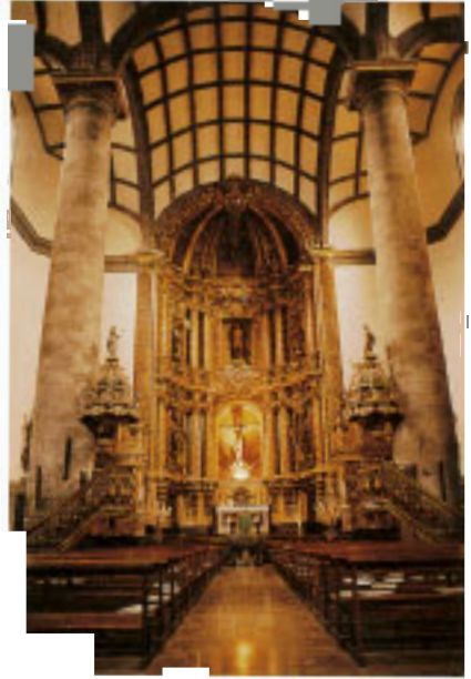
Interior de la Iglesia Parroquial de San Sebastián de Soresau.

Controlada la revuelta feudal, el territorio inició una etapa de despegue, apoyada en el comercio con Europa y los puertos americanos. Azpeitia gozaba de un buen número de ferrierías labrantes que producían abundante hierro, lo que le permitió desarrollar otras actividades comerciales. Además de estos factores dinamizadores, contaba con el privilegio