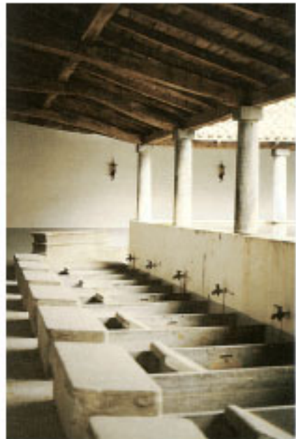
Lavadero de Abitain

El Arrabal de la Magdalena o de Abajo, ocupa los alrededores del camino hacia Zumaia. Los puntos de referencia son la