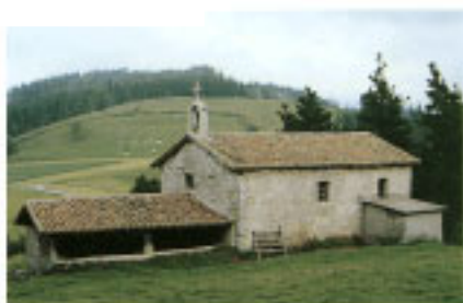
Ermita de San Miguel de Eizmendi.

Debido a la proximidad geográfica con respecto al núcleo principal de la población ha sido afectado por la fase industrial, existiendo modificaciones recientes en la trama urbana original, de base rural.