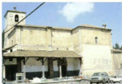
Iglesia de Nuestra Señora de la Asunción de Urrestilla.

Los accesos al centro urbano de esta entidad están marcados con la presencia de varios caseríos de llamativa construcción. En el tramo que conecta con Azpeitia destacan el caserío Larrañaga, la casa-torre de Antxieta, el caserío del mismo nombre, y el palacio de Ibarluze.