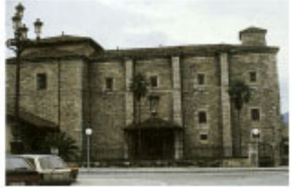
Convento de Santa Clara.

En las cercanías de la Iglesia, compar- tiendo la situación al borde del recinto amu-