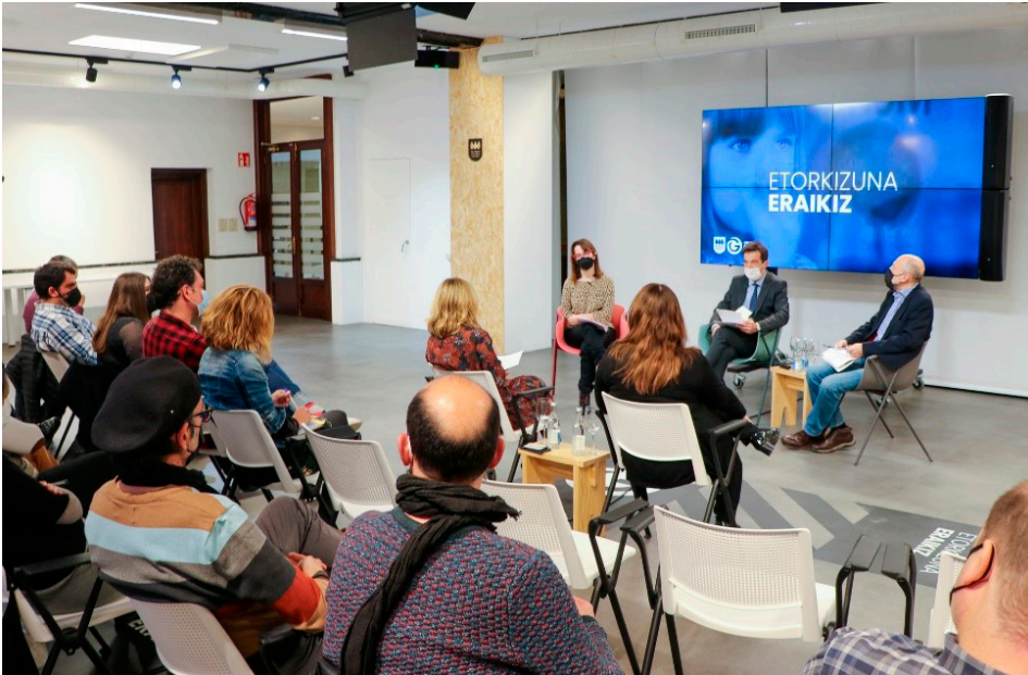
Gizarte lanaren etika publikoa. Gunea aretoa, martxoak 22

Ekitaldian 30 pertsona inguruk parte hartu zuten. Horietako asko Gipuzkoako Foru Aldundiko Gizarte Politikaketako Departamentuko langileak ziren, eta beren lana egiteko balio eta printzipioak kontuan hartzea zuen garrantzia berretsi zuten, beren lana etikoa, enpatikoa eta bidezkoa izan zedin.