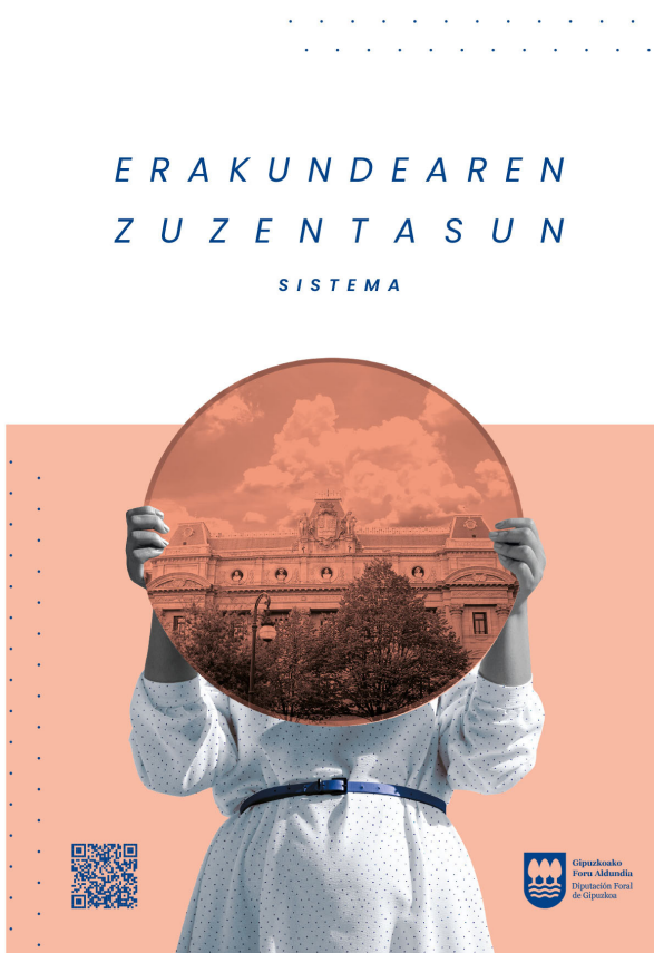
2022an argitaratutako dibulgazio-materiala

2021ean, kodeen edukia laburbilduta eta modu bisualagoan jasoko zuen hedapen-materiala sortzea erabaki zen, eskuragarriagoa eta atsegina izan zedin. Ildo horretan, EEBren 2022ko otsailaren 23ko bileran oniritzia eman zitzaion prestatzen ari ziren materialen zirriborroari. Material horiek argitaratu eta langileen artean banatu ziren, eta, gainera, jendearen eskura jarri ziren Arreta Bulego Nagusian.