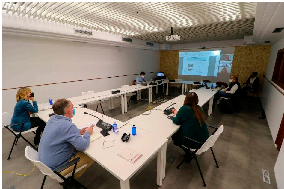
"Etika publikoa eta pandemia" jardunaldia