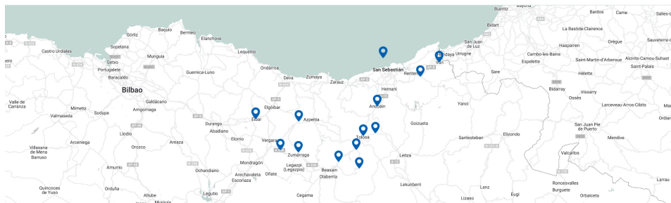
Gobernu Irekiaren Gipuzkoako Behatokia bistaratzea