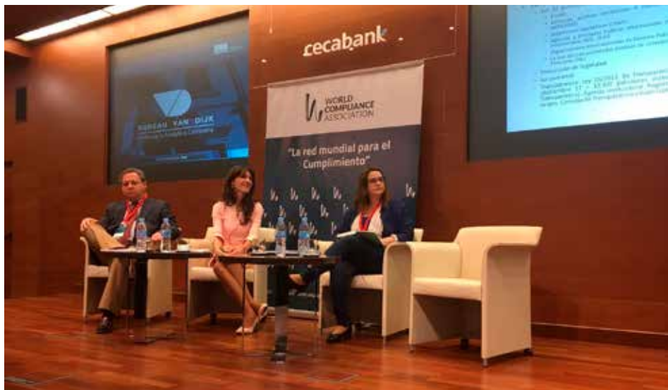
Compliance Sektore Publikoan ezartzeari buruzko II. Kongresua Madril, martxoaren 27a