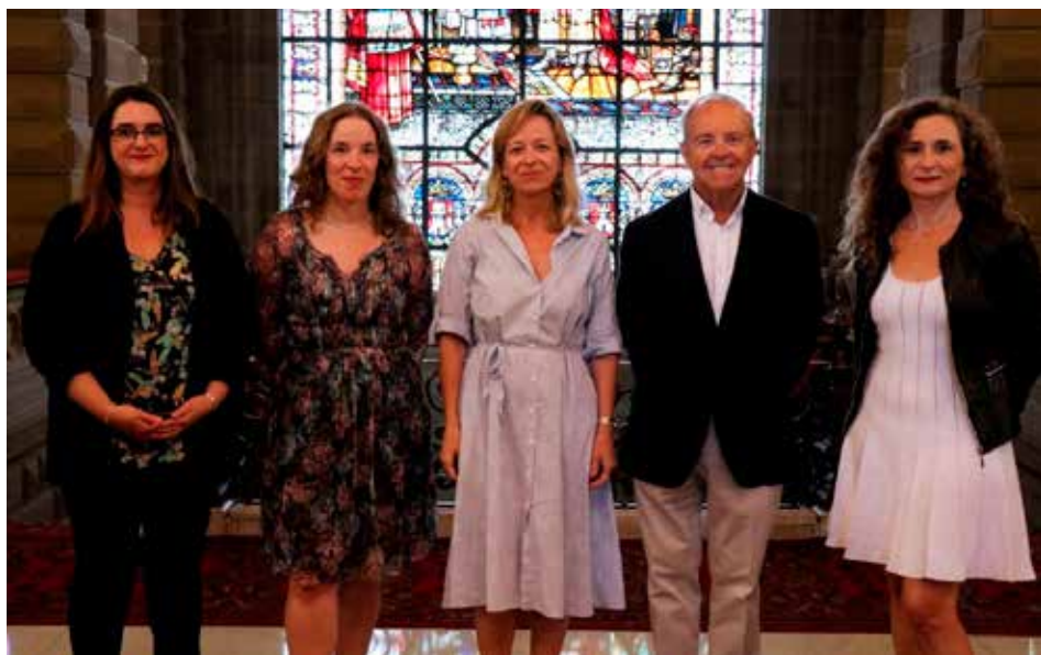
Erakundearen Etika Batzordearen gaur egungo kideak