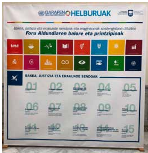
Foru Aldundiaren Jauregiaren sarreran dagoen panela

GJHei buruzko panel handi batzuk egin ziren. Horien artean, 16. GJH nabarmendu zen: Justizia, Bakea eta Erakunde Irmoak. GJH horren helburu nagusia da gizarte bakezaleak eta inklusiboak sustatzea garapen jasangarrirako, justizia guztion eskura izatea errazteko eta erakunde eraginkorrak, erantzuleak eta inklusiboak sortzeko maila guztietan. Helburu hau lortzeko, garrantzitsutzat jotzen da gobernu guztiek, gizarte zibilak eta komunitateek batera lan egitea konponbide iraunkorrak praktikan jartzeko, zehazki, indarkeria murrizten dutenak, justizia egiten dutenak, ustelkeriari era efikazean aurre egiten diotenak eta une oro partaidetza inklusiboa bermatzen dutenak. Eta, argi eta garbi, premisa horiek guztiak estuki